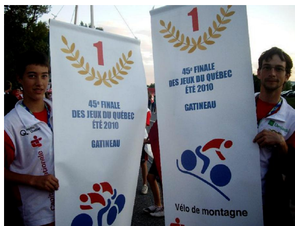
Que demander de mieux ? Champions en route et montagne ☺