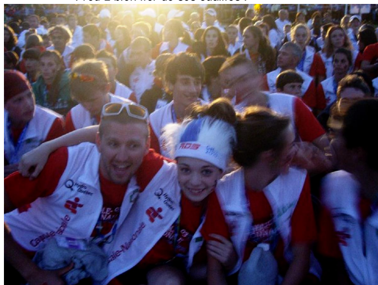
Tous costumés en attendant la parade de fermeture !