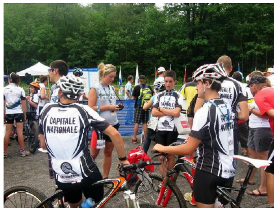
Ça relaxe fort après l'entraînement des cadets !!!

La journée du mercredi réservée à l'entraînement cross country qui se Nous avons donc un peu dormir, déjeuner et flâner avant de prendre ce fut très apprécié par les les entraîneurs !