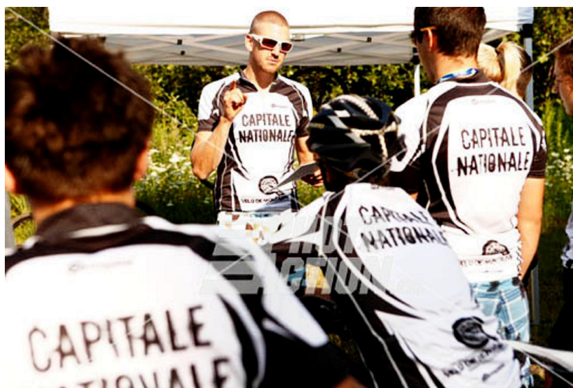
Les instructions pour le relais ne pouvaient être plus claires !