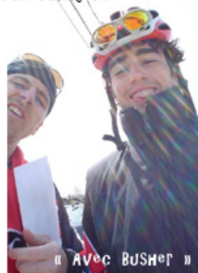
« Avec Busher »