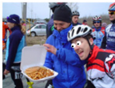
« Le Repos (pas) du Guerrier »